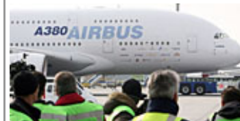
Der A380 in Frankfurt