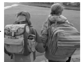
Berliner Str./Ecke Bommersheimer W. Kinder der Anwohner? Schulweg? Weg zum Spielplatz?

Fazit: Die in den angrenzenden Wohngebieten gesteigerten Gefahren der Verkehrsströme zum und vom geplanten Schulgebäude werden völlig verharmlost und unterschätzt. Die Unfallgefahren werden übersehen.