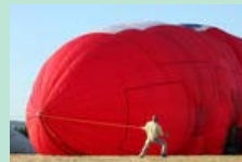
Luftschiff-Parade in Bad Homburg