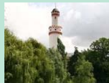
Schloss-Spaziergang in Bad Homburg