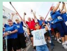
Zimmersmühlenlauf in Oberursel

Heute um 18.12 Uhr wird Bad Homburg am Kurhausvorplatz einen Menschaufmarsch erleben, bei dem alle Teilnehmer ihre Handys in den Himmel recken. Mehr