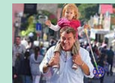
Laternenfest in Bad Homburg