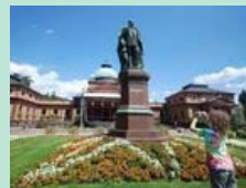
Stadt-Bilder: Bad Homburg