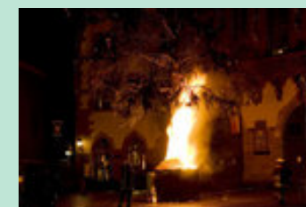
Weihnachtsbaum in Frankfurt brennt