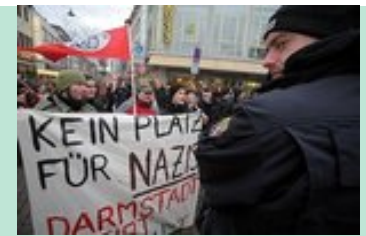
Darmstadt: Protest gegen rechte Kundgebung