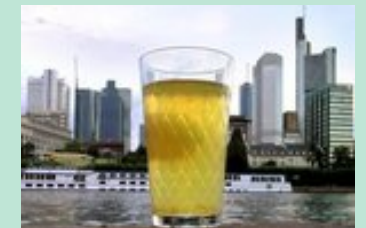
Jahresrückblick 2007: Was die Region bewegte