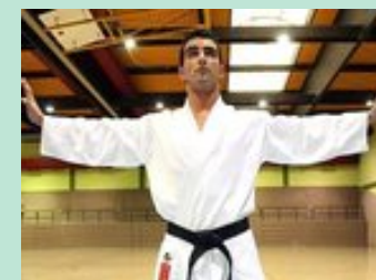
Kickboxer Hüseyin Imam