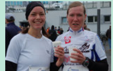
29. Mainova Silvesterlauf in Frankfurt