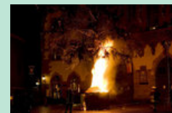
Weihnachtsbaum in Frankfurt brennt